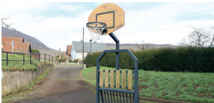
But brésilien à l'aire de jeux Jean Ritzenthaler de Kientzheim