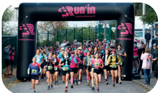
Trai'Elle, Kayersberg > 12 octobre