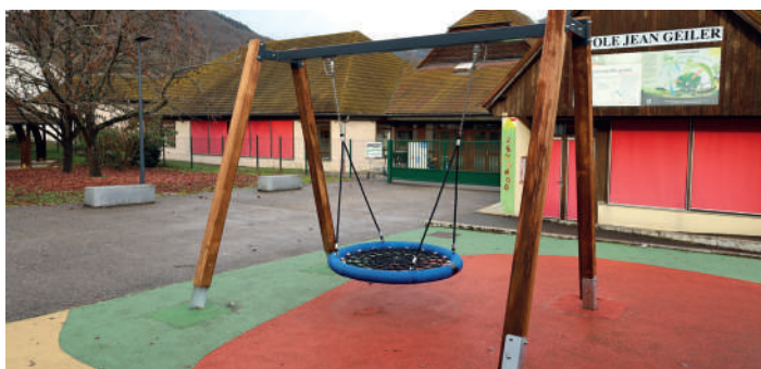
Balançoire nid d'abeille devant l'école Jean Geiler à Kayersberg