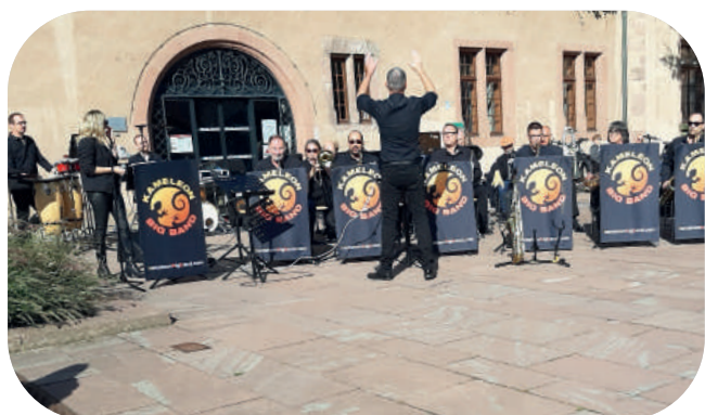
Apéritif-concert du Kaméléon Big Band, place de la Mairie, Kayersberg > 28 septembre